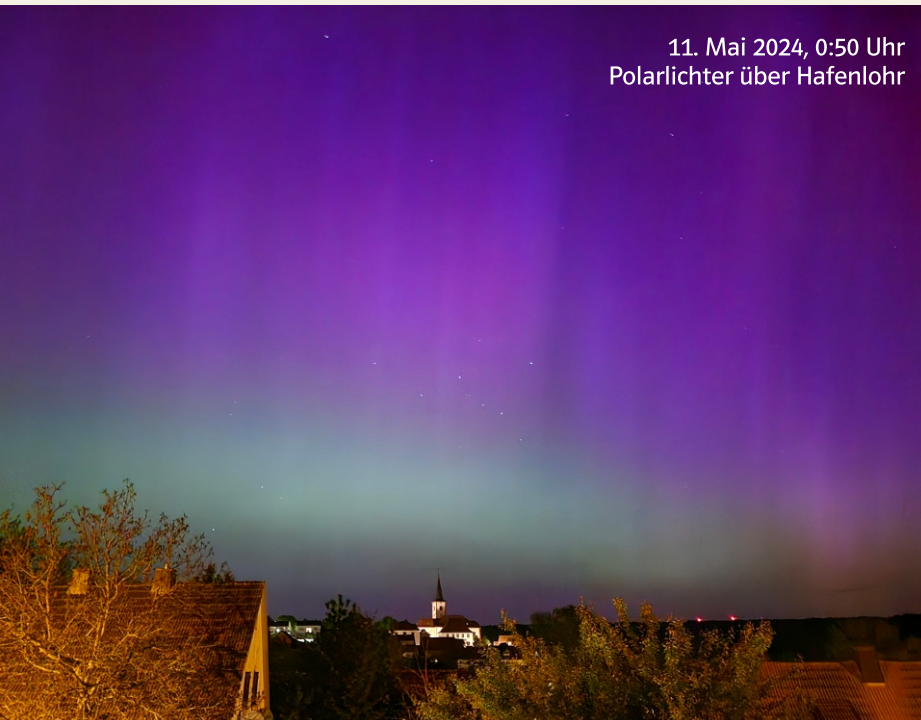
11. Mai 2024, 0:50 Uhr Polarlichter über Hafenlohr

Weitere Bürgermeister-Sprechstunden sind nach Absprache jederzeit möglich.